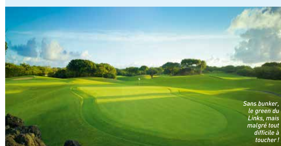
Sans bunker, le green du Links, mais malgré tout difficile à toucher!