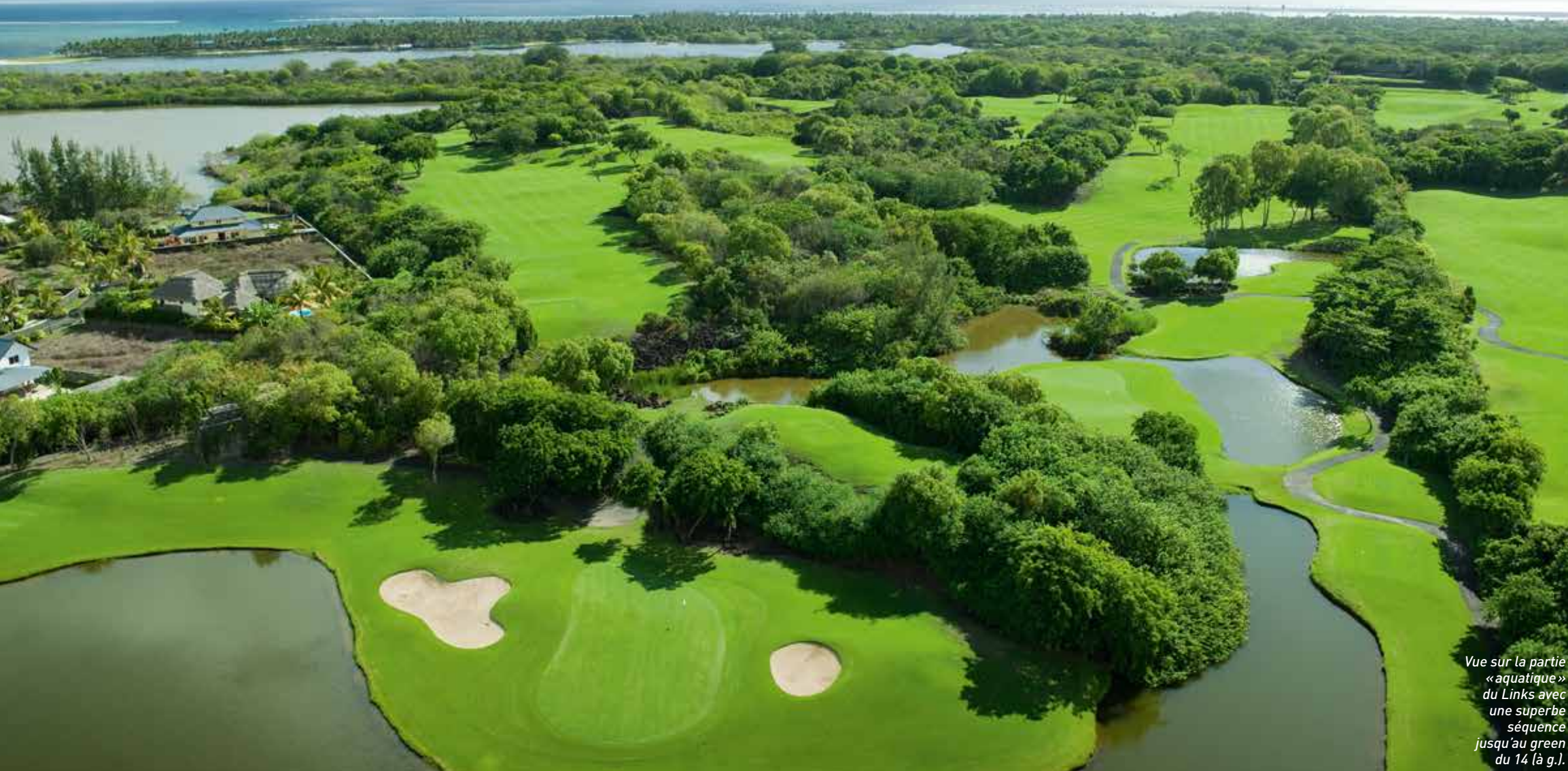
Vue sur la partie «aquatique» du Links avec une superbe séquence jusqu'au green du 14 (à g.).