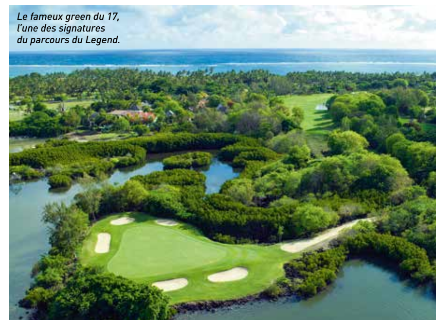
Le fameux green du 17, l'une des signatures du parcours du Legend.