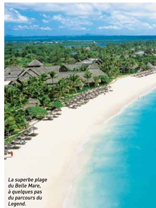
La superbe plage du Belle Mare, à quelques pas du parcours du Legend.