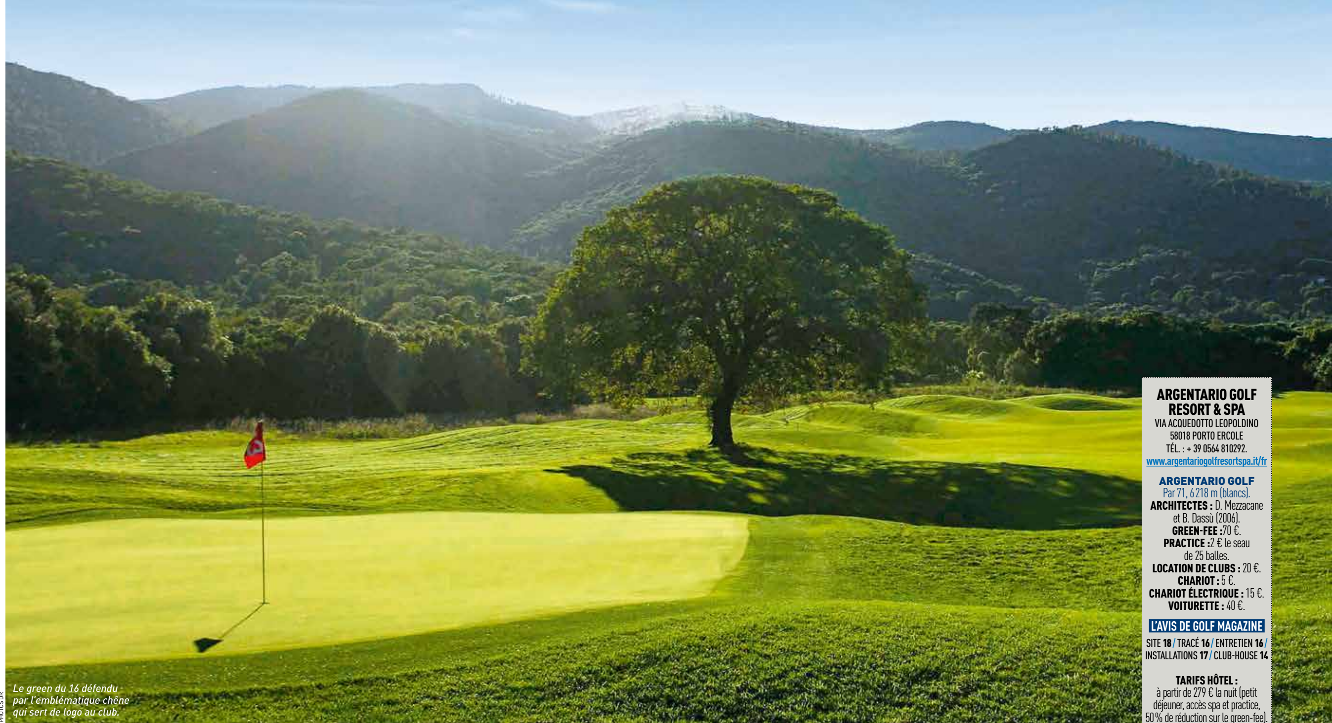
Le green du 16 défendu par l'emblématique chêne qui sert de logo au club.

Les premiers trous de l'Argentario sont très exigeants.