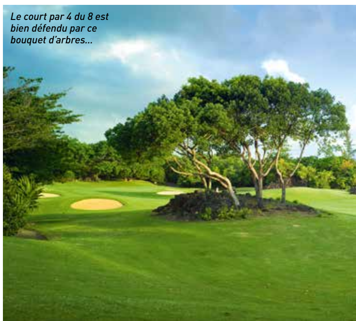
Le court par 4 du 8 est bien défendu par ce bouquet d'arbres...

Le tracé du Legend, qui date de 1994, est un véritable jardin tropical.