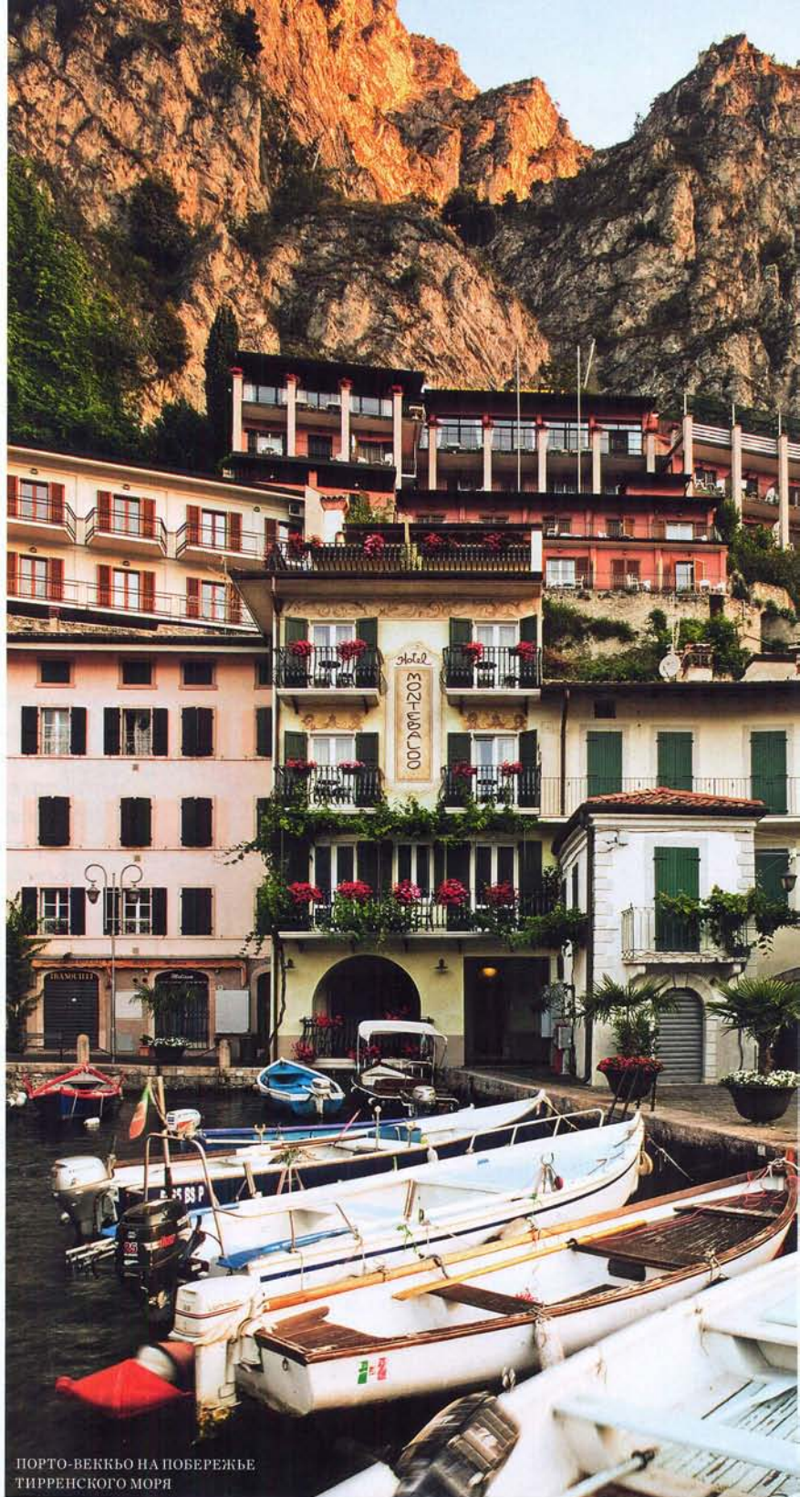
ПОРТО-ВЕККЬО НА ПОБЕРЕЖЬЕ ТИРРЕНСКОГО МОРЯ

Мелкий песок или галька, вид на лес или очертания городского порта вдаль – на побережье Тирренского моря множество совершенно разных пляжей. Среди самых красивых и удобных – Tuscany Bay, на котором отдыхают постояльцы отеля Argentario Resort Golf & Spa . Отдельные кабинки для загара, ресторан Le Colonie с разнообразными блюдами из рыбы и морских гадов и бар, где по вечерам выступают музыканты, – все продумано настолько досконально, что отсюда не хочется уходить. Если вам больше по душе дикие и уединенные пляжи, отправляйтесь в западную часть Монте-Арджентарио – там даже в самый разгар сезона немногочисленно. Пляж Ла Фенилья предпочитают большие семьи, а любители экстрима обычно ловят волну близ дюны Томболо делла Джаннелла.