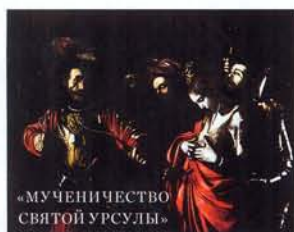
«МУЧЕНИЧЕСТВО СВЯТОЙ УРСУЛЫ»

КАЖДЫЙ МЕСЯЦ НА ГОЛЬФ-ПОЛЯХ ARGENTARIO RESORT GOLF & SPA ПРОХОДИТ ДО ДЕСЯТИ СОРЕВНОВАНИЙ.