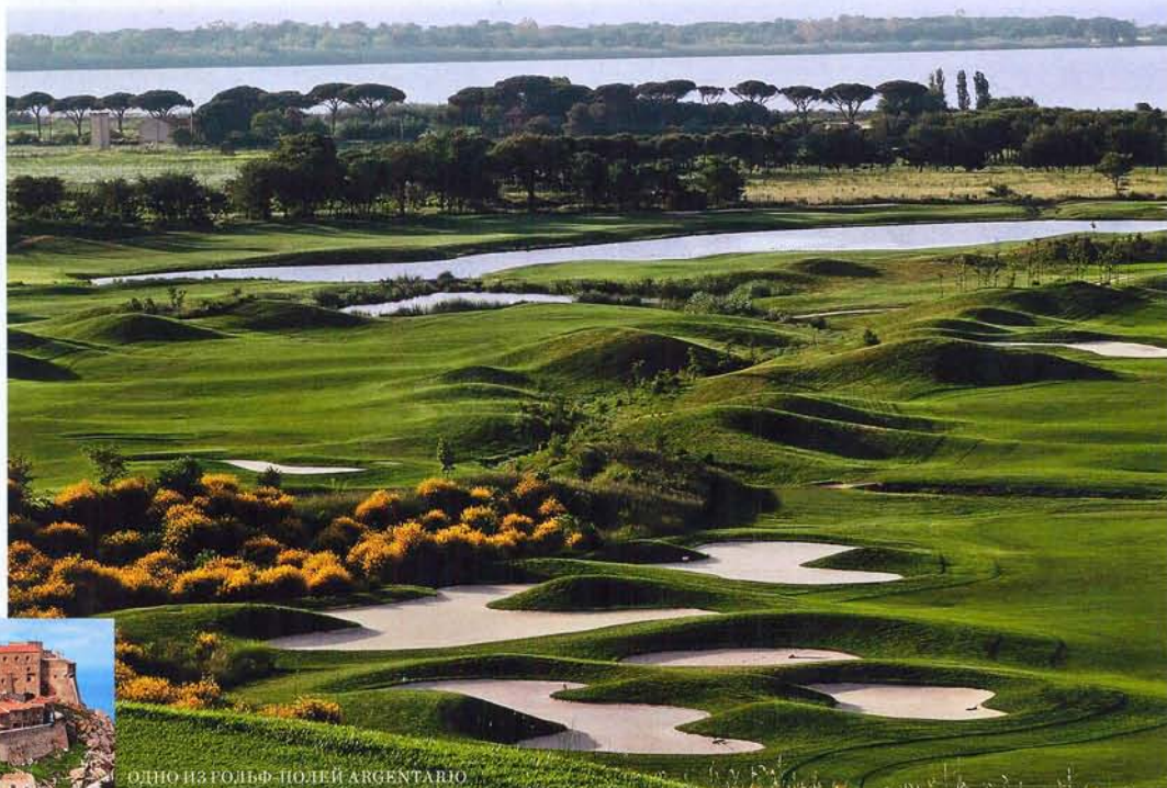
ОДНО ИЗ ГОЛЬФ-ПОЛЕЙ ARGENTARIO

Считается, что могила великого художника находится именно в Порто-Эрколе – в церкви Сант Эразмо.