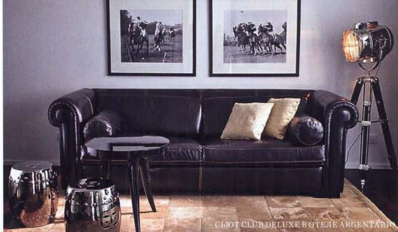
СЪЮТ CLUB DELUXE В ОТЕЛЕ ARGENTARIO

В спа-центр отеля Argentario (который, между прочим, уже пару лет подряд получает награды от ведущих изданий о путешествиях как лучший в Европе) стоит заглянуть хотя бы раз, чтобы опробовать на себе одноименный комплекс процедур Argentario . Массаж делают с оливковым и лавандовым маслом, а пилинг – с морской солью; все ингредиенты местные. Для тех, кто решил основательно заняться своим здоровьем, здесь есть отдельная медицинская зона, где работают диетологи и натуропаты.