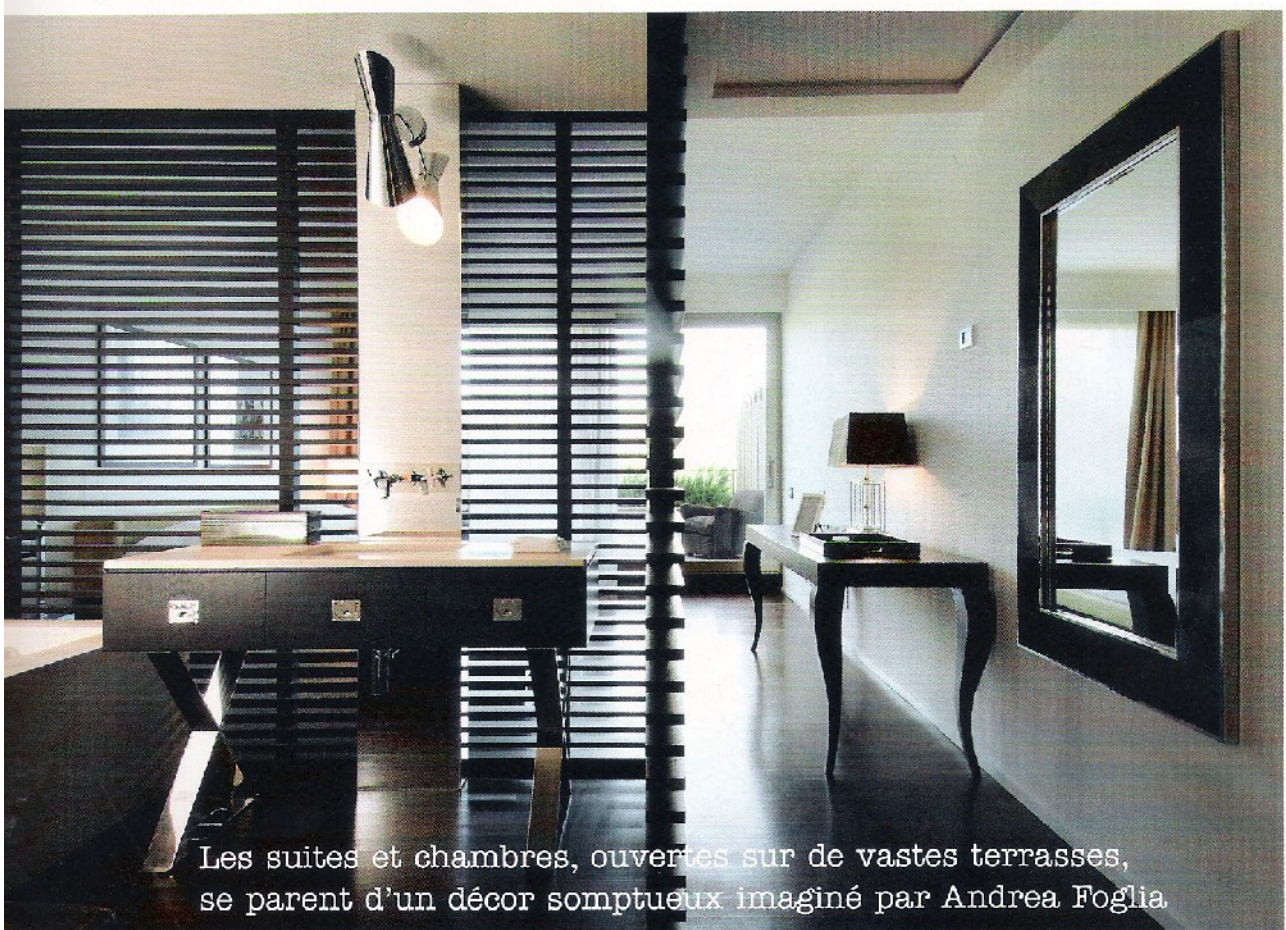
Les suites et chambres, ouvertes sur de vastes terrasses, se parent d'un décor somptueux imaginé par Andrea Foglia.