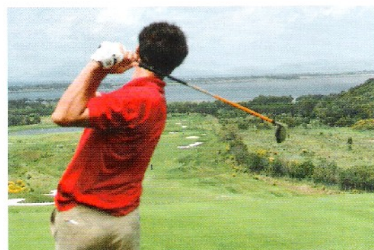
98 HÔTEL & LODGE