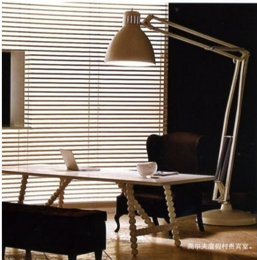
高尔夫度假村贵宾室。