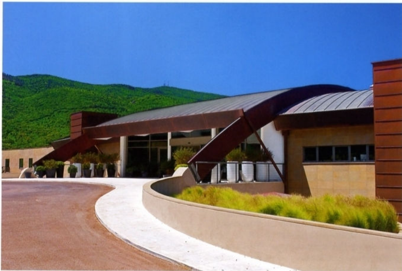
高尔夫度假村入口。

在15世纪的苏格兰，牧羊人经常玩一种用驱羊棍击石子的游戏，比比谁击得远、击得准。21世纪的今天，这种名叫“Golf”（高尔夫）的运动已经风靡世界。正如它的名字告诉我们的那样，高尔夫不仅需要脚部运动（F），更需要绿色（G），氧气（O）和阳光（L）。